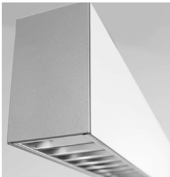
Einzelleuchte mit BAP-Raster