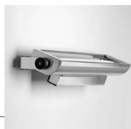
Solo für 1 x TC-L 36 W